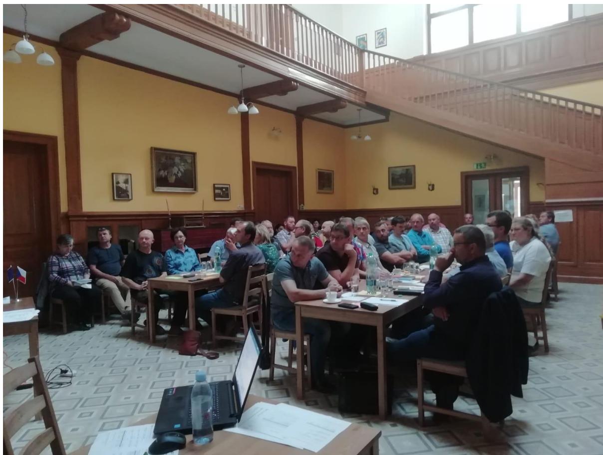
Jednání členské schůze 25. 6. 2020

Nejvyšším orgánem MAS je členská schůze , jejíž počet členů k 31. 12. 2020 byl 67 členů. Členská schůze schvaluje stanovy a rozhoduje o jejich změně, schvaluje koncepce a rozvojové programy, zřizuje povinné orgány (rozhodovací, kontrolní, výběrový), volí a odvolává předsedu a místopředsedu a schvaluje výši členských příspěvků. Schvaluje také výroční zprávy a zprávy o hospodaření.