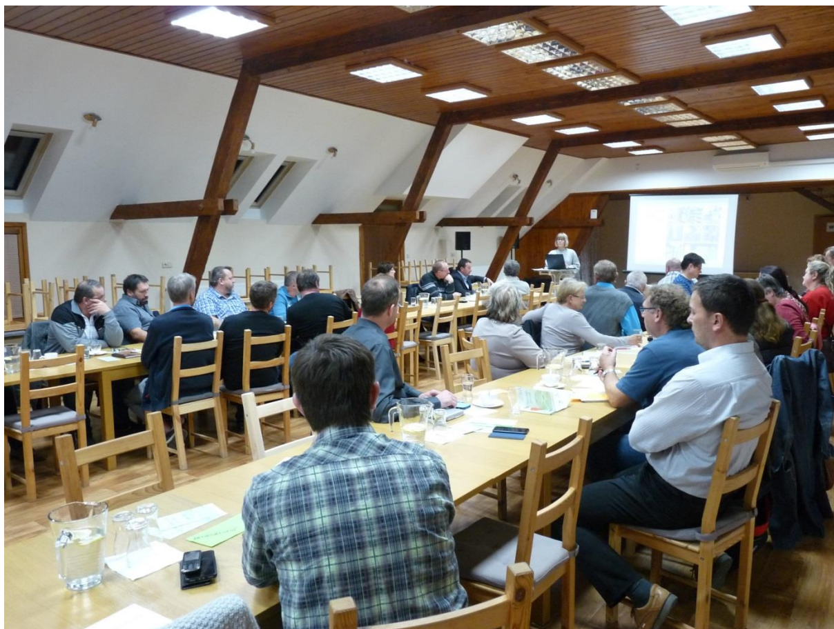
Jednání členské schůze 19. 11. 2019

Nejvyšším orgánem MAS je členská schůze , jejíž počet členů k 31. 12. 2019 byl 62 členů. Členská schůze schvaluje stanovy a rozhoduje o jejich změně, schvaluje koncepce a rozvojové programy, zřizuje povinné orgány (rozhodovací, kontrolní, výběrový) volí a odvolává předsedu a místopředsedu, a schvaluje výši členských příspěvků. Schvaluje také výroční zprávy a zprávy o hospodaření.