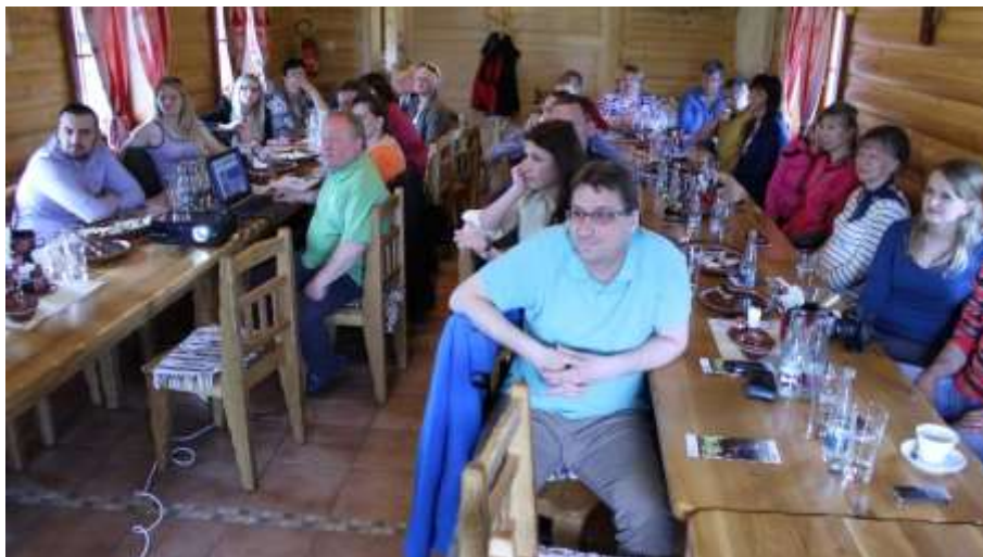
Závěrečná konference k projektu „Společně jsme na koni“ v MAS MALOHONT

V roce 2015 byly ukončeny a proplaceny projekty spolupráce „Příběhy našich kronik“ a „Společně jsme na koni“.