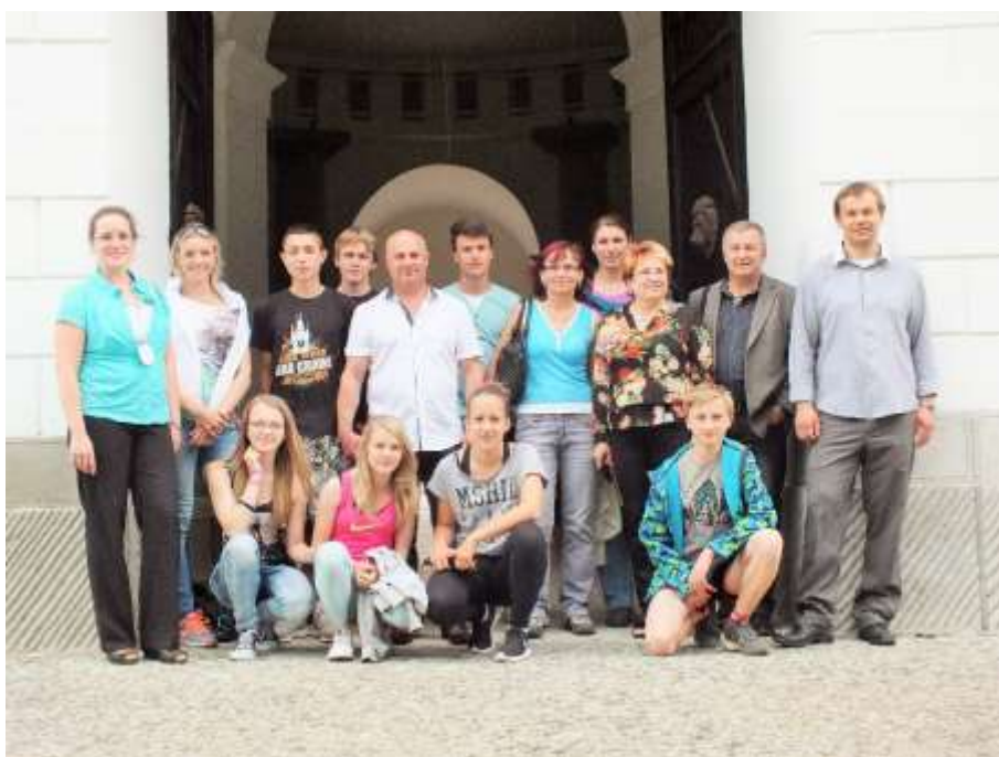
Návštěva zástupců MAS Hříběcí hory a ZŠ Morkovice v Žitavanech (Mikroregion Tribečsko)

V roce 2015 byla navázána spolupráce a podepsána partnerská dohoda se slovenským Mikroregionem Tribečsko Miestnou akčnou skupinou. Zástupci Mikroregionu byli dvakrát na návštěvě v MAS Hříběcí hory a jednou jeli zástupci české MAS na Slovensko do Žitavan. V současné době se čeká, jak dopadne hodnocení strategie na Slovensku.