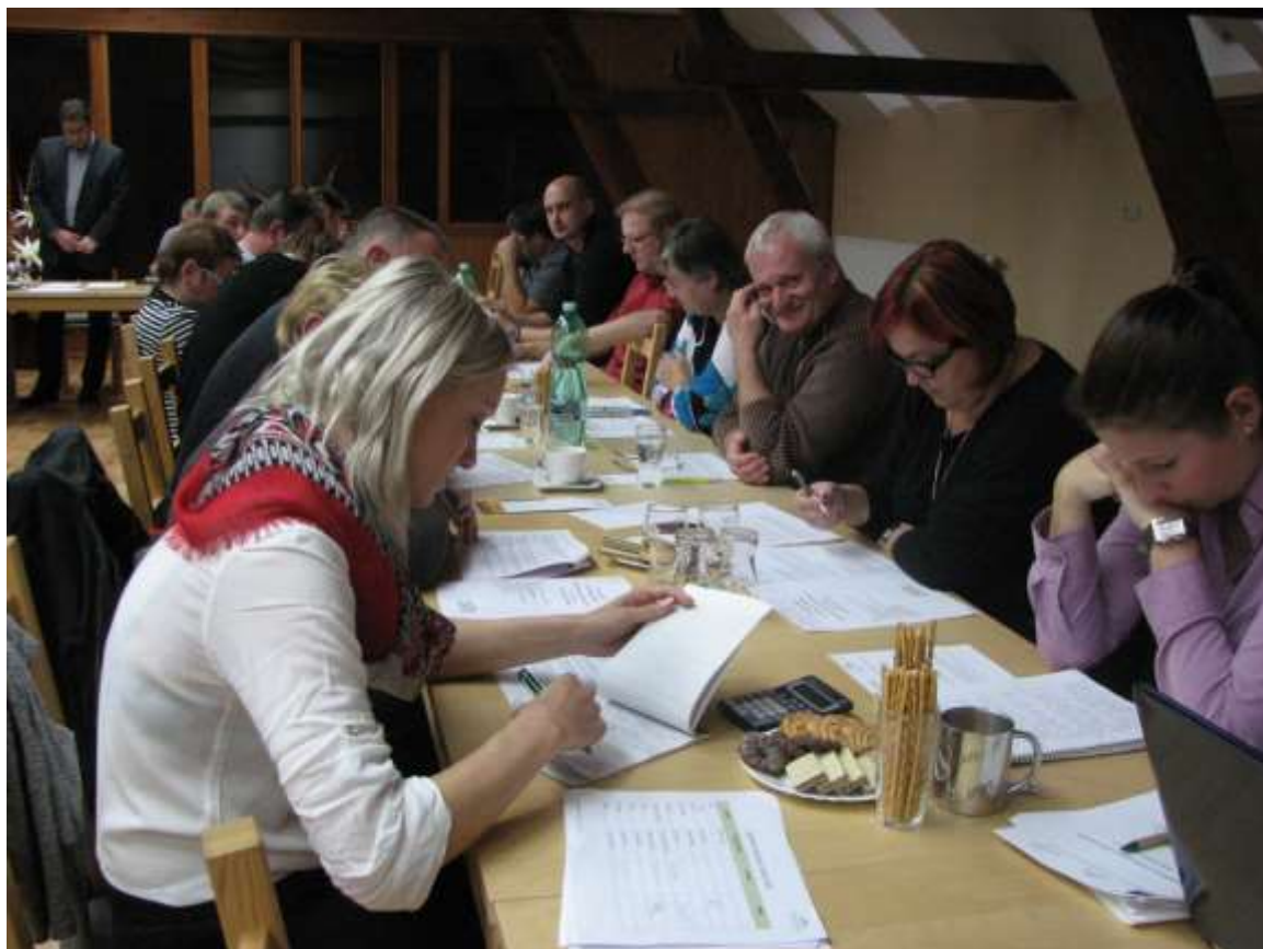
Jednání členské schůze dne 3. 11. 2015

Nejvyšším orgánem MAS je členská schůze . K 31.12.2015 měla členská schůze 63 členů. Členská schůze schvaluje stanovy a rozhoduje o jejich změně, schvaluje koncepce a rozvojové programy, zřizuje povinné orgány: rozhodovací, kontrolní, výběrový, volí a odvolává předsedu a místopředsedu, schvaluje výši členských příspěvků. Schvaluje také výroční zprávy a zprávy o hospodaření.