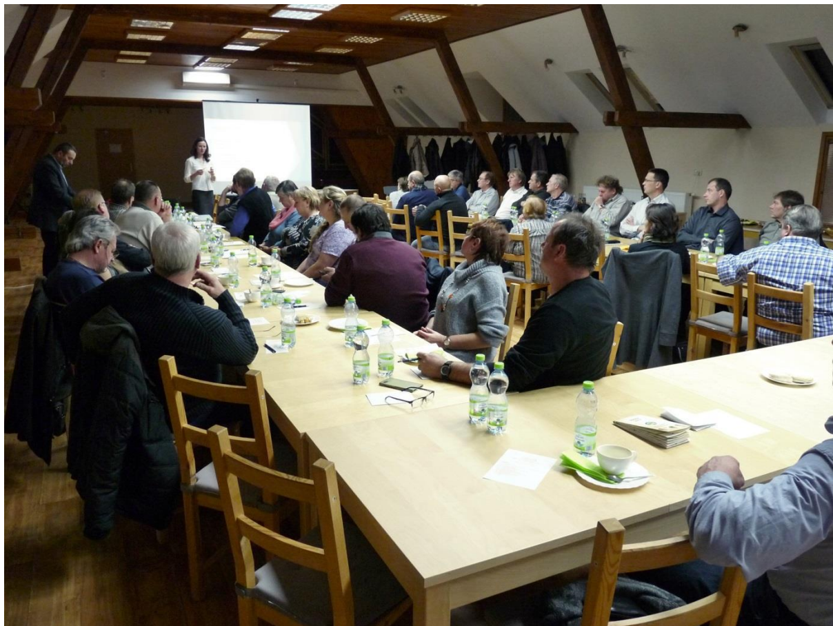
Jednání členské schůze 14. 12. 2017

Nejvyšším orgánem MAS je členská schůze , jejíž počet členů k 31. 12. 2017 byl 61 členů. Členská schůze schvaluje stanovy a rozhoduje o jejich změně, schvaluje koncepce a rozvojové programy, zřizuje povinné orgány (rozhodovací, kontrolní, výběrový) volí a odvolává předsedu a místopředsedu, a schvaluje výši členských příspěvků. Schvaluje také výroční zprávy a zprávy o hospodaření.