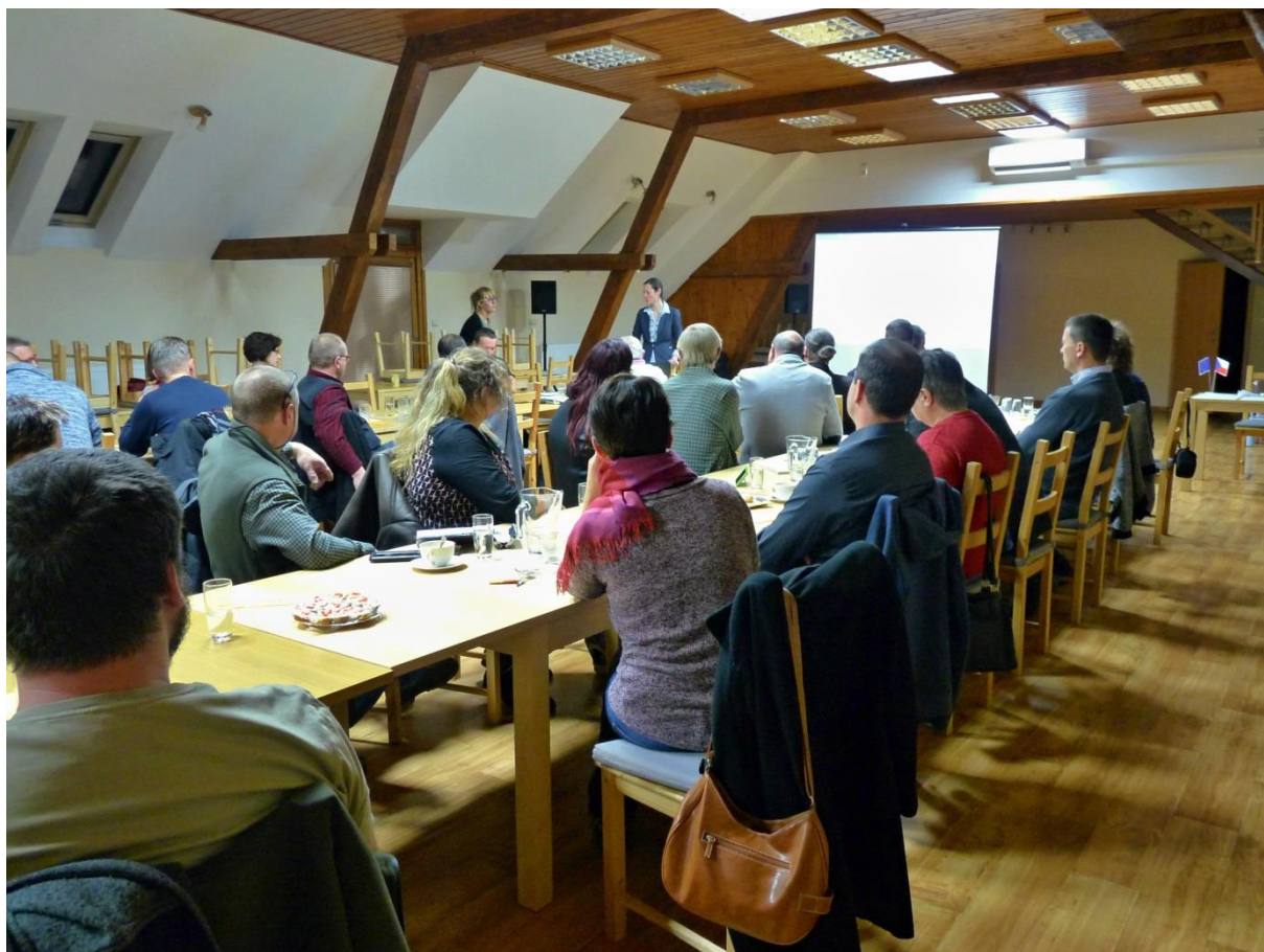
Jednání členské schůze 27. 11. 2018

Nejvyšším orgánem MAS je členská schůze , jejíž počet členů k 31. 12. 2018 byl 62 členů. Členská schůze schvaluje stanovy a rozhoduje o jejich změně, schvaluje koncepce a rozvojové programy, zřizuje povinné orgány (rozhodovací, kontrolní, výběrový) volí a odvolává předsedu a místopředsedu, a schvaluje výši členských příspěvků. Schvaluje také výroční zprávy a zprávy o hospodaření.